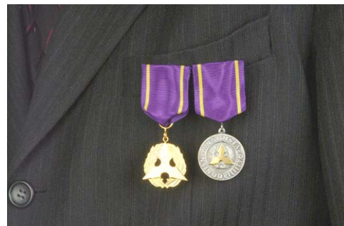
Kunniajäsenmitali, kultainen ansiomitali