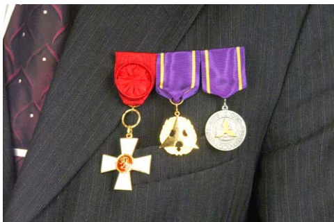
Suomen leijonan 1. luokan ritarimerkki, kunniajäsenmitali, kultainen ansiomitali