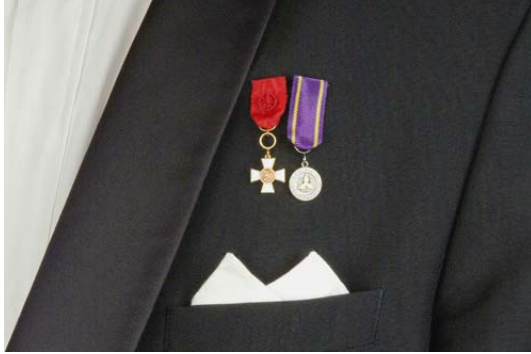
Pienoiskunniamerkit: Suomen leijonan 1. luokan ritarimerkki, kultainen ansiomitali