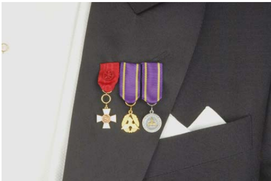
Pienoiskunniamerkit: Suomen leijonan 1. luokan ritarimerkki, kunniajäsenmitali, kultainen ansiomitali