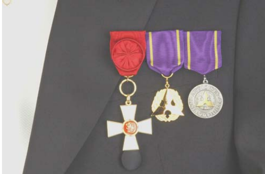
Suomen leijonan 1. luokan ritarimerkki, kunniajäsenmitali, kultainen ansiomitali