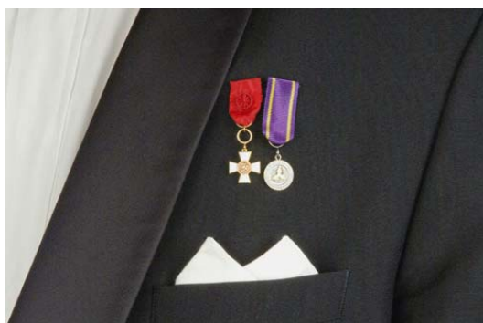
Pienoiskunniamerkit: Suomen leijonan 1. luokan ritarimerkki, kultainen ansiomitali

Pienoiskunniamerkit kiinnitetään frakissa takin vasempaan rintakäänteeseen napinläven korkeudelle ja smokissa vastaavalle paikalle. Kummassakin asussa käytetään pienoiskunniamerkkien kanssa rintataskunenäiliinaa (valkoista),