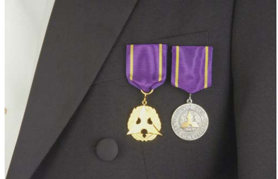
Kunniajäsenmitali, kultainen ansiomitali