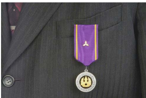
Kultainen ansiomitali soljin

Mikäli henkilöllä on useita Insinööriliiton myöntämiä ansiomitaleita, käytetään viimeksi myönnettyä mitalia. Poikkeuksen tekee kunniajäsenmitali, jota kannetaan aina ansiomitalin kanssa.