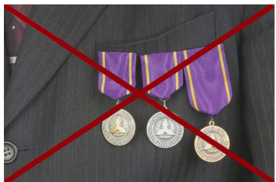
Kultainen, hopeinen ja pronssinen ansiomitali